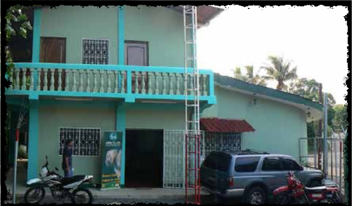
Oficinas de AMICTLAN, financiadas por la Agencia Catalana de Cooperación al Desarrollo (ACCD).

La AMICTLAN celebra su quinto aniversario de conformación estrenando casa propia, gracias al financiamiento de la Agencia Catalana de Cooperación al Desarrollo (ACCD), instancia que acompaña a la asociación desde su nacimiento el 31 de julio del 2006.