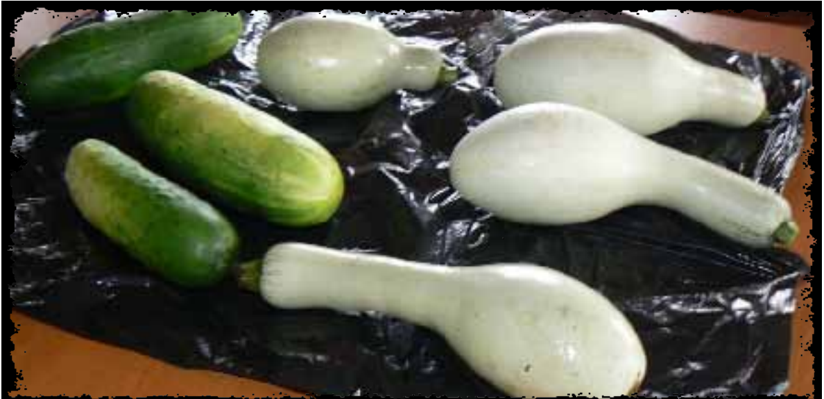
Pipianes y pepinos cosechados en los huertos familiares.

Gracias al programa Territorios de la Laguna de Apoyo Lideran su Ordenamiento y Comanejo (TLALOC), desarrollado por AMICTLAN, diez familias de diferentes municipios que conforman la Laguna de Apoyo fueron beneficiadas con insumos para crear sus propios “huertos familiares”.