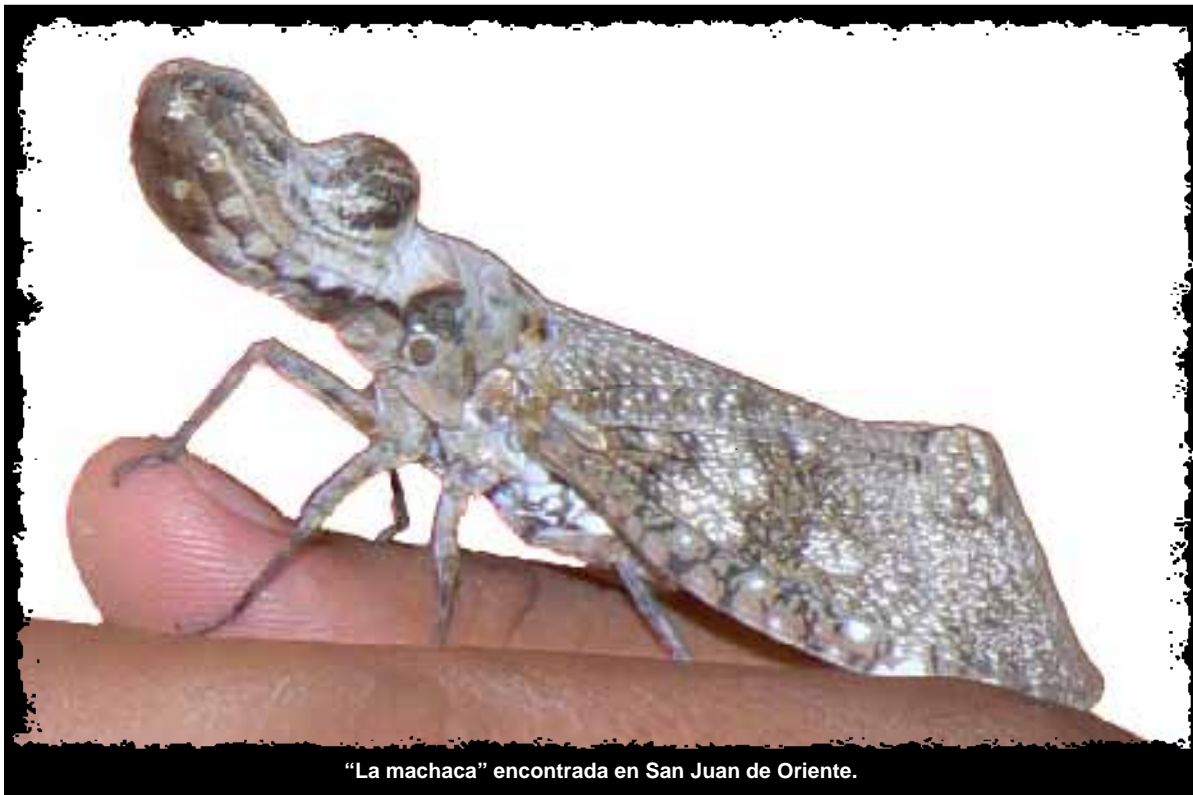
“La machaca” encontrada en San Juan de Oriente.

Habita en México, Centro América y Sudamérica