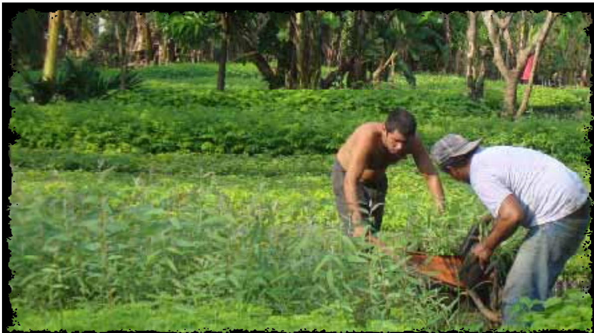
Las plantas fueron entregadas por la AMICTLAN en las fincas de los productores.